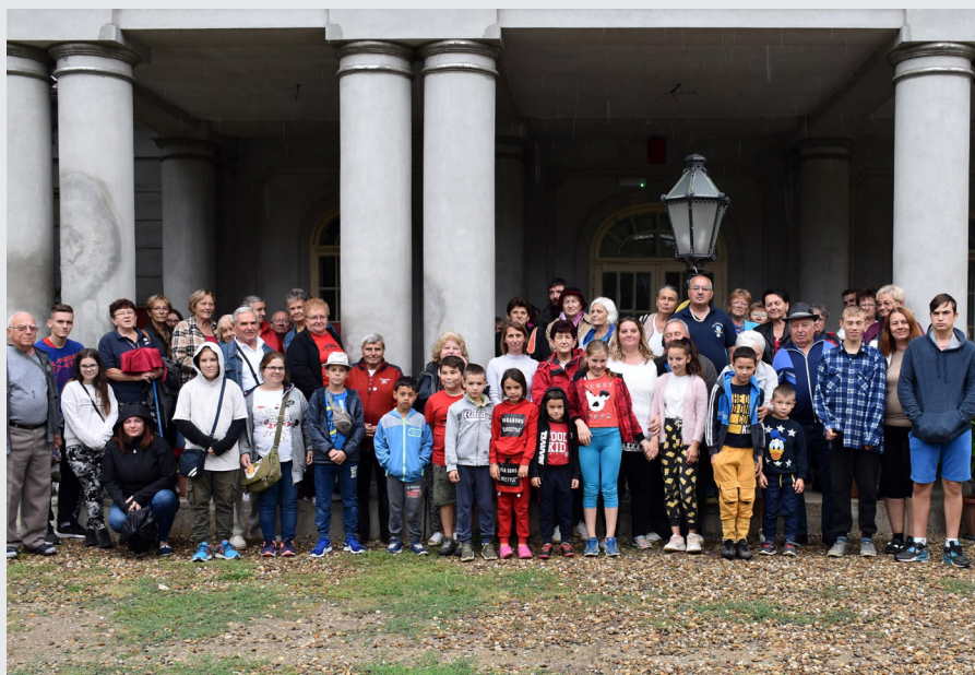
A kirándulók és a gyermekotthon lakói

A tápiógyörgyei Torockó Baráti Társaság 50 fős kirándulócsoportja 2021. augusztus 27-én látogatást tett a Dévai Szent Ferenc Alapítvány által működtetett székelyházi Gyermek Jézus Otthonban. Székelyhíd – nevével ellentétben – nem a Székelyföldön fekszik, hanem a magyar határhoz közel, a többségében ma is magyarul beszélő tájegységben helyezkedik el. Az otthon a település központjában talál-