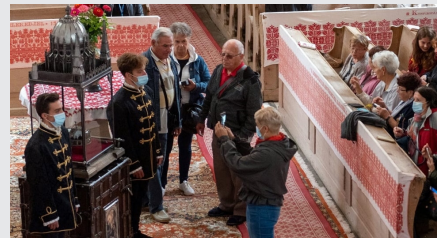
A Szent Korona másolatának kiállítása a torockói unitárius templomban