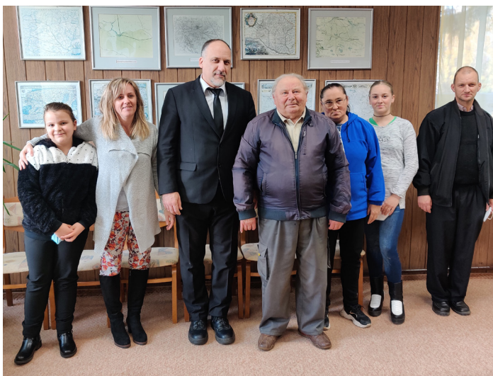
Református istentisztelet előtt a Művelődési Házban

neteken keresztül megismerkedhetnek a keresztyén hittel, Istennel, tisztább képet alkothatnak magukról, egymásról, a világról. Többen már konfirmáltak is közülük.