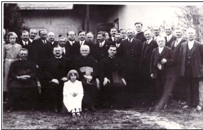
Bérmálás Tápiógyörgyén 1939 április 21-én