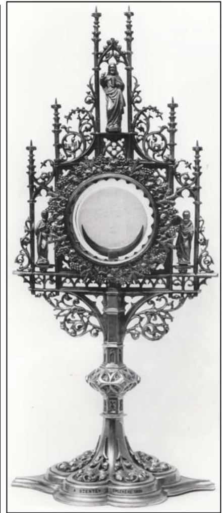
A györgyei Szent Anna templom gótikus szentségtartója (aranyozott), a Szentév tiszteletére adományozták a hívek