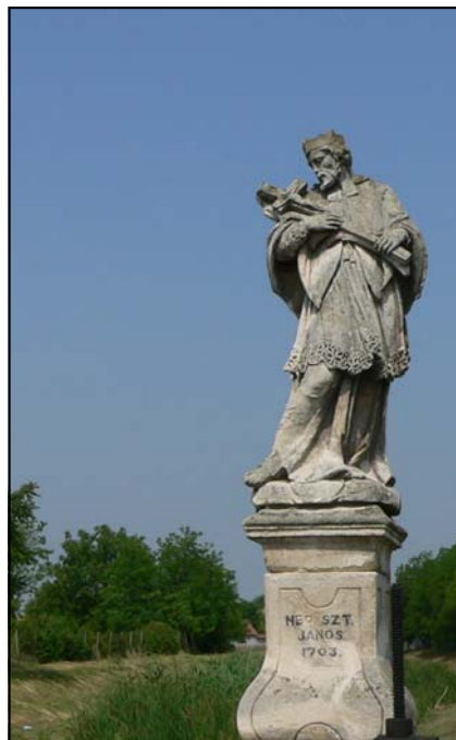
Nepomuki Szent János szobra a Tápió partján

A tisztán katolikus község szolgálatot teljesítő plébánosa, káplánja kiemelten fontosnak tartotta az egyházi szertartások, misék, litániák, körmenetek, elsőáldozások, bérmlások igényes, színvonalas megrendezését, - kiemelten a húsvéti, pünkösdi, úrnap, karácsonyi ünnepkörhöz tartozó szertartások megvalósítását, celebrálását. Rendkívül fontos volt a kántor személye, felkészültsége, ezért a kántor-tanító megválasztása a falu nagy eseménye volt, sokszor ellentmondásokkal, intrikákkal, vitákkal, szubjektív megítélésekkel. Az egyházközség kántor-tanító kiemelkedő